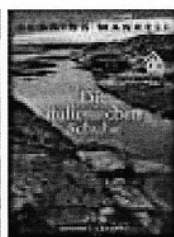
Die italienischen Schuhe