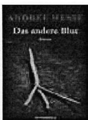
Das andere Blut